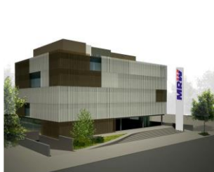
MRW – Sede Central Barcelona (España)