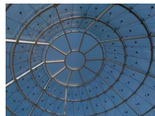
Reserve Bank Pretoria (Sudáfrica)