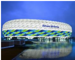
ALLIANZ ARENA Múnich (Alemania)

Ejemplos de edificios en donde ha sido utilizado el producto PENOSIL Silicona neutra C-22: