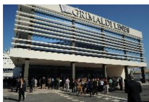
Terminal Grimaldi – Puerto Barcelona (España)