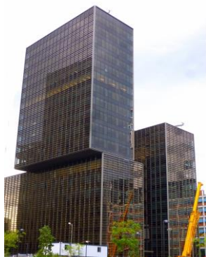
Cuatrecasas abogados Barcelona (España)