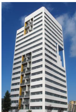
100-Edificio viviendas Barcelona (España)

Ejemplos de edificios en donde ha sido utilizado el producto PENOSIL Silicona neutra C-22c: