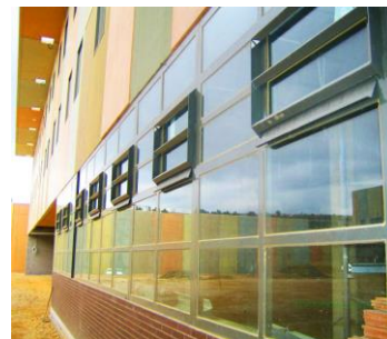
Centro Prisión Figueres (España)