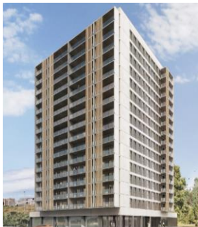
Viviendas L'Hospitalet (España)

Ejemplos de edificios en donde ha sido utilizado el producto PENOSIL Silicona neutra C-22ral: