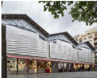
"El ninot" Mercado Barcelona (España)